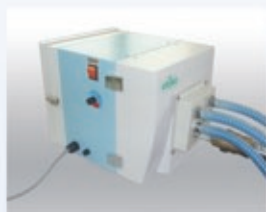
带4个接头的进气口